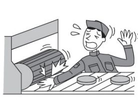
機械にまきこまれケガをした。