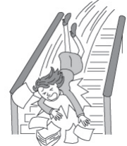
階段で転倒しケガをした。