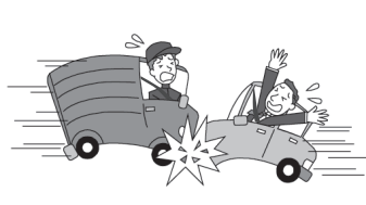
車が衝突しケガをした。