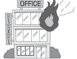
火災にあいケガをした。