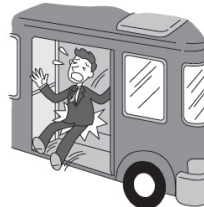
バスのステップを踏みはずしケガをした。