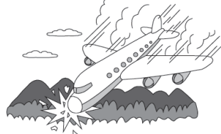
出張中、旅客機がついし死亡した。