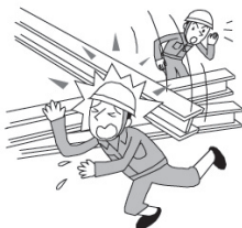
資材が倒れケガをした。